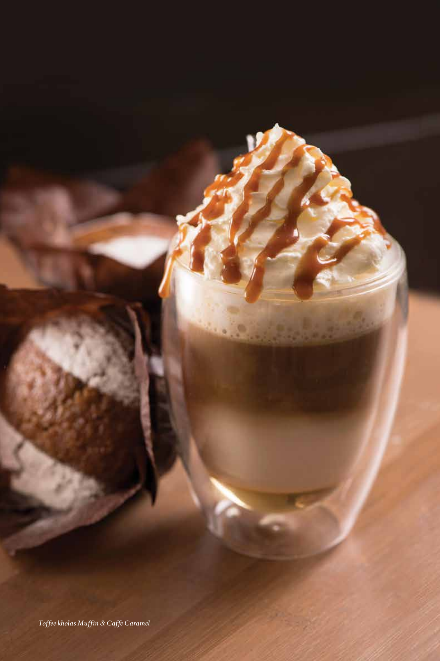
Toffee kholas Muffin & Caffè Caramel