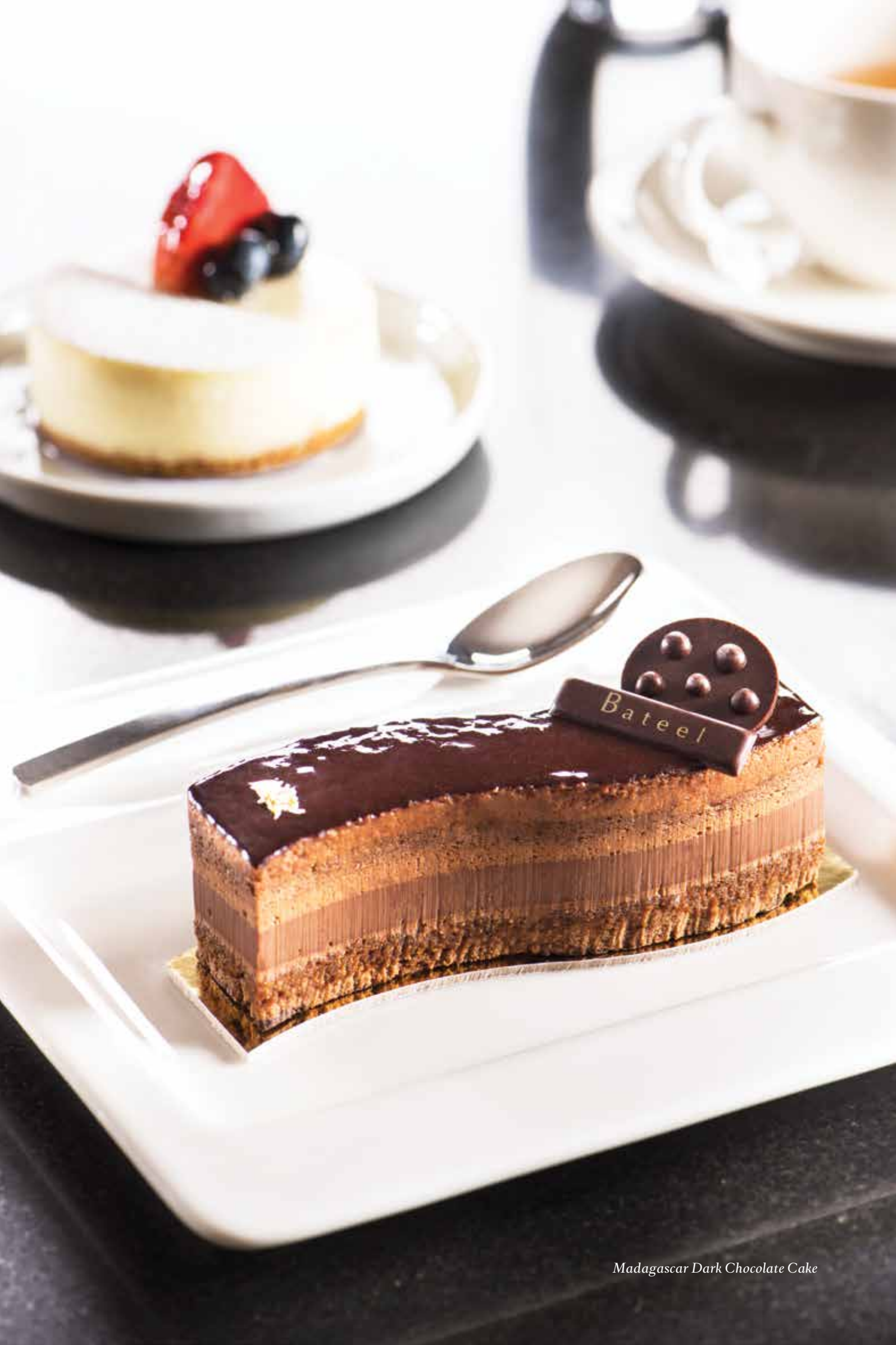
Madagascar Dark Chocolate Cake