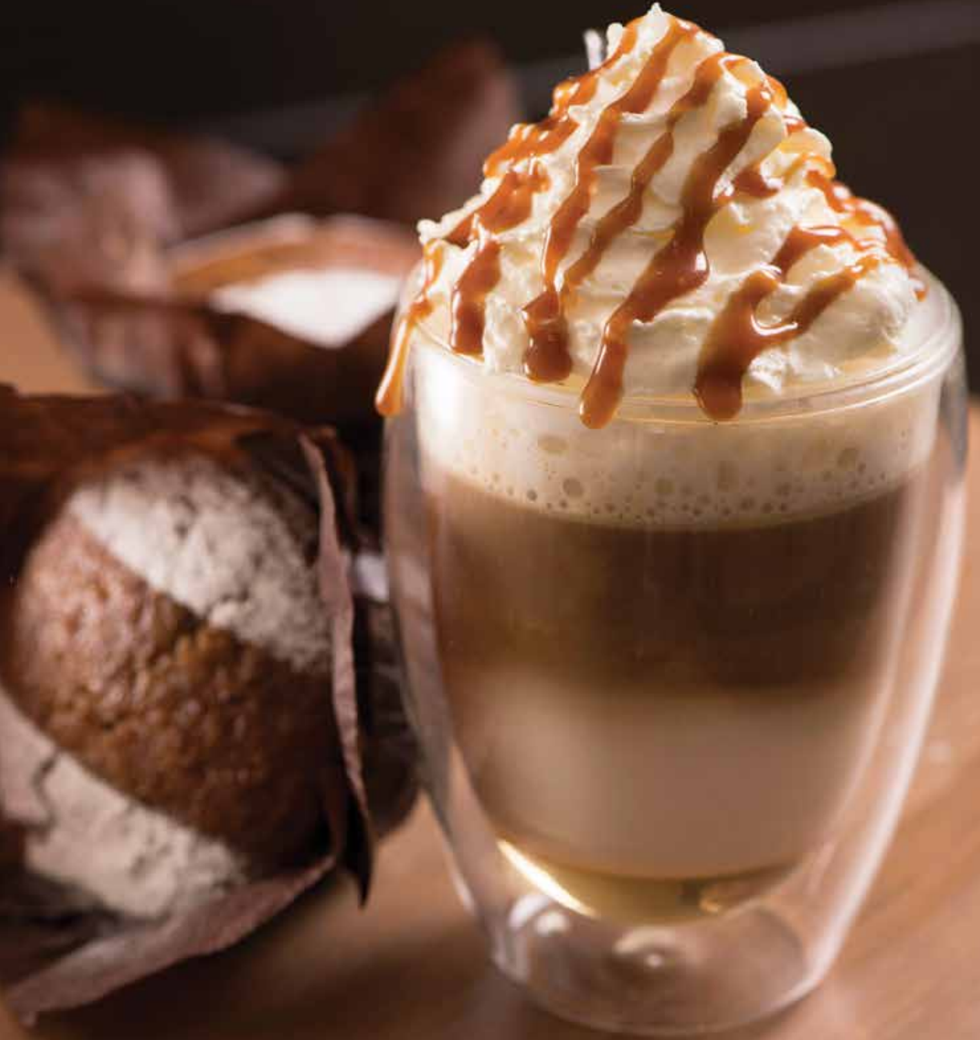
كافيه كراميل ومافن التوفي مع تمر الخلاص